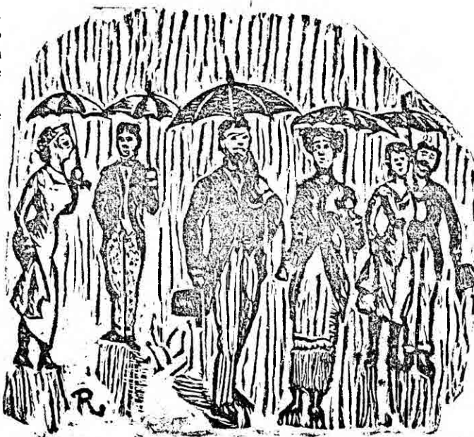
VISITANDO EL INTERIOR DEL PABELLON LIBERTY.